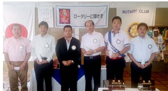
7月会員誕生の各会員