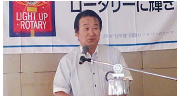
相澤出席副委員長より無断欠席禁止について