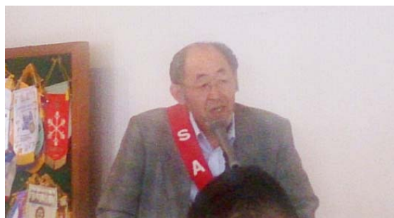
遠田 S.A.A より例会の注意事項を発表